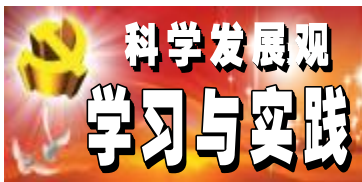
科学发展观 学习与实践

本报讯 检修分厂在坚决打赢控亏增盈攻坚战中,重视宣传思想政治工作,充分利用设备卫士报、设备卫士之声广播、网络信息平台、橱窗板报等载体,宣传形势任务,总结和推广企业文化建设的先进经验,用身边的人和事坚定员工信念,激发员工工作热情。“设备卫士之声”广播每天上下班时间四次播出,自2002年创办的“设备卫士报”一直坚持出版,橱窗板报紧密结合实际及时更换,多种宣传载体共同丰富了设备卫士特色文化,在分厂营造出注重科学,勤于创新,勇于拼搏,积极奉献的氛围,为保障企业科学发展提供了强有力的思想保证。